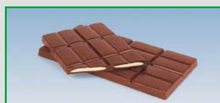
Long One-Shot tablets