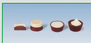
Double-Layer Power One-Shot