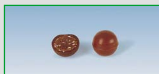
One-Shot with ingredients