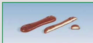
Long One-Shot filled bars